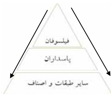
نمودار شماره ۱: نظام سیاسی هر می افلاطون

در این بین حتی در نظام سیاسی سعادت‌محور و غایت‌محور افلاطونی (که بر تأمین سعادت حقیقی بشر و انسان‌ها در بستر اجتماع تأکید دارد و مهم‌ترین وظیفه و کارویژه حاکمیت را تحقق فضیلت عدالت و سعادت‌مندی شهروندان عنوان می‌کند) باز مسئله محبت و رابطه معنوی بین حاکم و مردم مغفول واقع شده است و وی در پیشبرد اهداف نظام سیاسی فیلسوفانه خود و تضمین اطاعت‌پذیری قاعده هرم سیاسی (توده‌ها) از رأس هرم (فیلسوف‌شاه)، به جای «اصالت‌بخشی» به ضمانت اجرایی عاطفی و قلبی حکومت‌ورزی، بر قدرت اسلحه طبقه پاسداران و اقتضانات ساختاری مولد قدرت در هندسه سیاسی پیشنهادی هر می شکل خود، اکتفا کرده است؛ یا لااقل سخنی از مقوله محبت به میان نمی‌آورد و از آن به‌عنوان محور شکل‌دهی به مناسبات میان رهبران و مردم یاد نمی‌کند (افلاطون، ۱۳۸۶: ص ۲۳۰-۲۲۹).